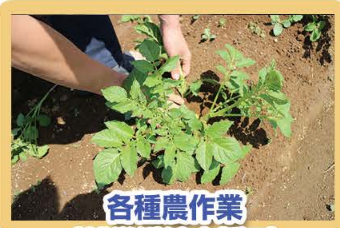
各種農作業 (就労継続支援B)