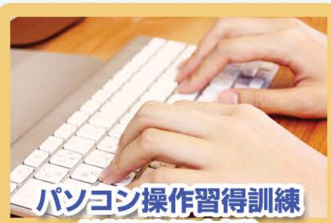
パソコン操作習得訓練 (就労移行支援)