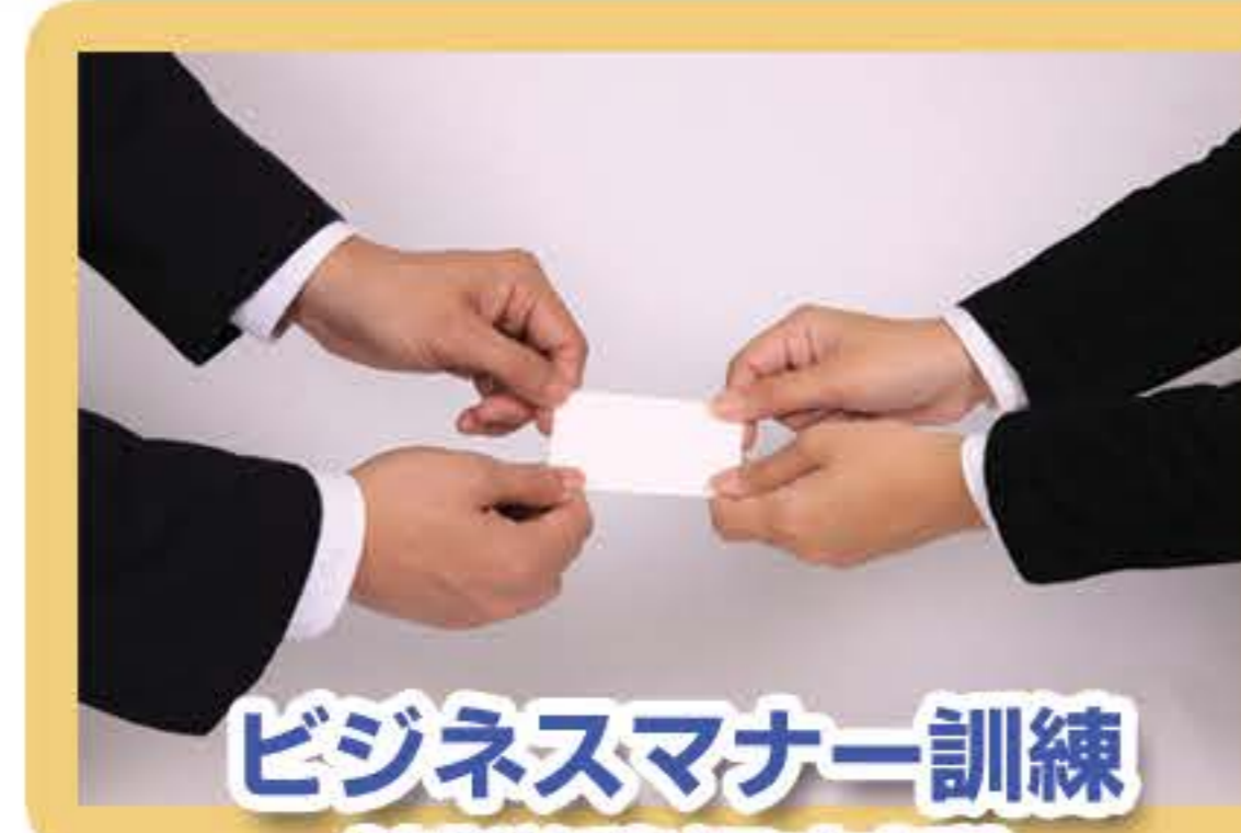
ビジネスマナー訓練 (就労移行支援)