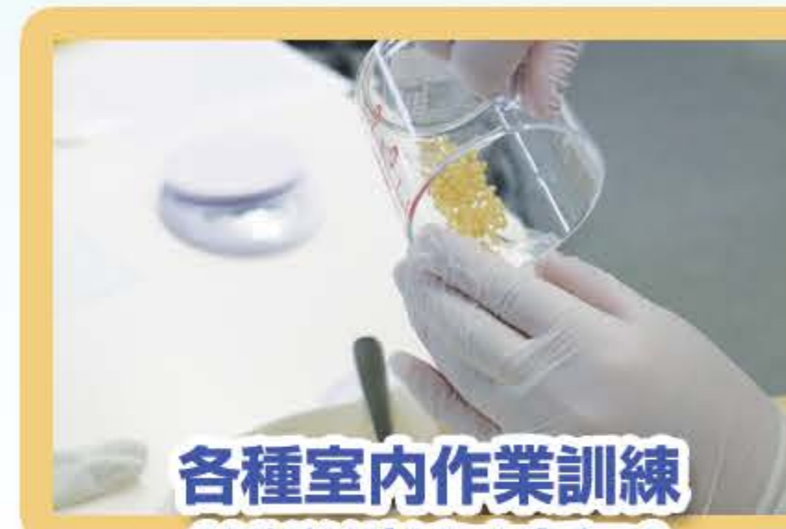
各種室内作業訓練 (就労継続支援B)